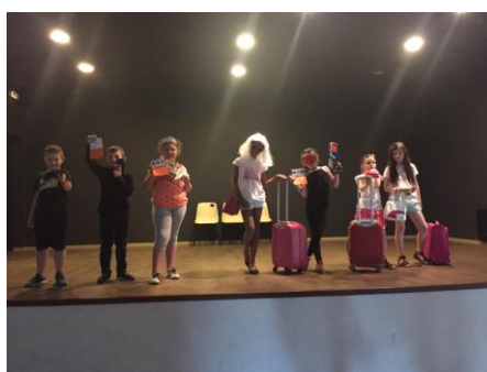
Les enfants du CLAS, lors de leur représentation.

Durant cette année, nous avons élaboré avec notre personnel le Document Unique d'Evaluation des Risques au travail. Nous allons mettre en œuvre les pistes d'amélioration dégagées durant cet inventaire.