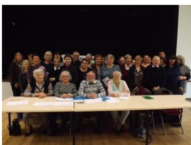
Les adhérents lors de l'Assemblée Générale