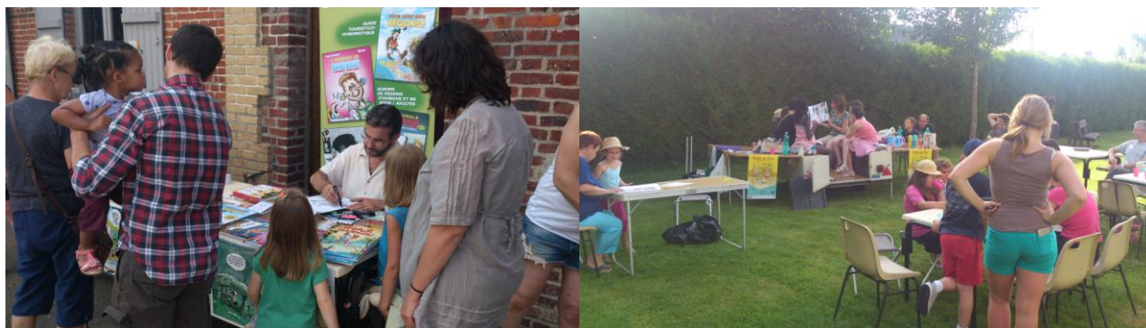
Notre salon du livre Jeunesse, intitulé « PARTIR EN LIVRE ».