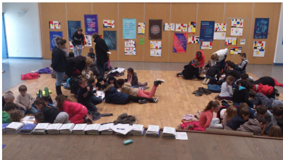
Les semaines de la langue française et de la Francophonie.