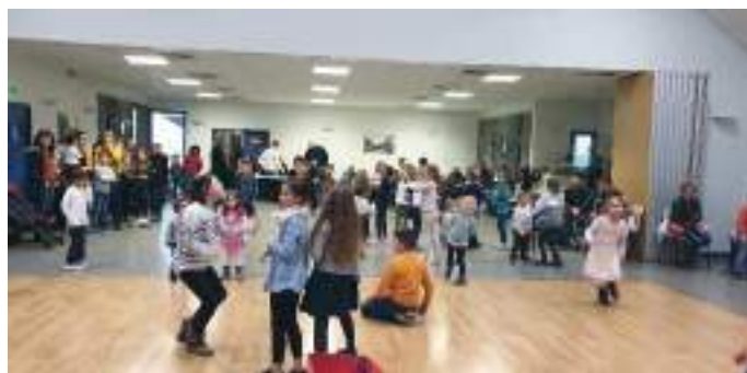
Noël des enfants