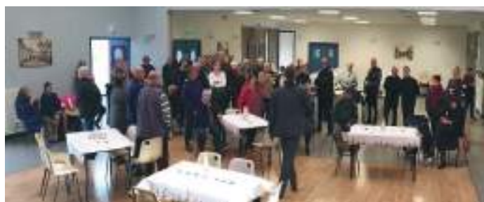
Noël de nos aînés