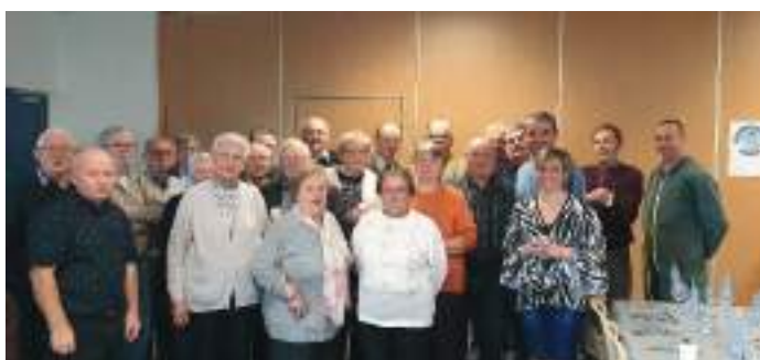
30 ans du Carrefour de l'Amitié