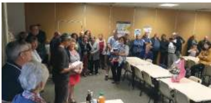
Départ en retraite de notre secrétaire de Mairie