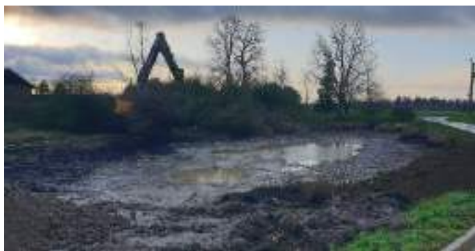
Curage de la mare du Bifauvel