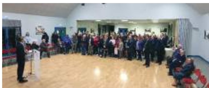
Cérémonie des vœux