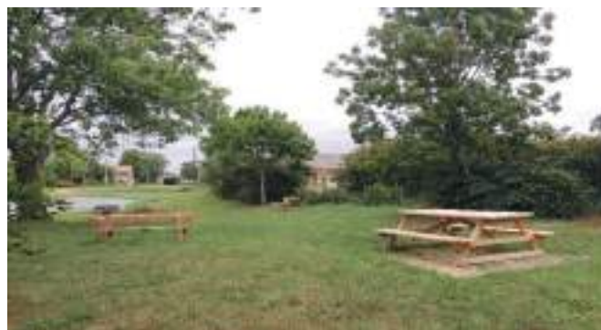
1ers aménagements à la mare du Bifauvel