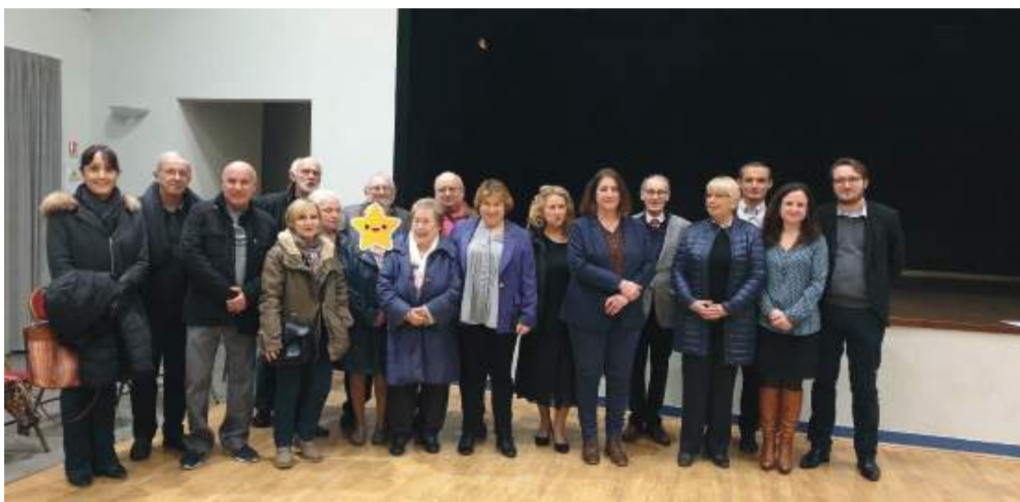
En présence de la Députée, Madame OPETIT, de Monsieur BEAUFILS Maire d'Étrépagny et de Monsieur RASSAERT, VP du Département

Ce titre honorifique récompense l'implication des bénévoles et des citoyens dans la vie et les actions de notre village. Une vingtaine de personnes s'est vue recevoir cette médaille.