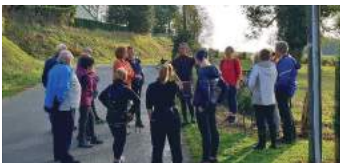
Découverte de nos chemins lors de la semaine bleue