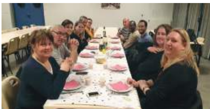
Atelier Nutrition, Plaisir, Santé