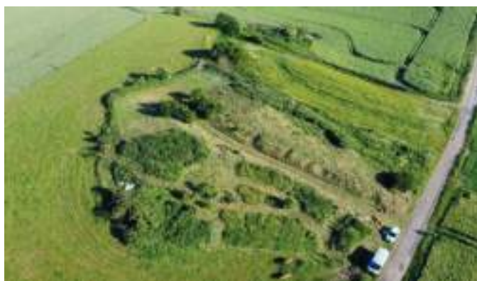
Carrière communale : espace de Biodiversité