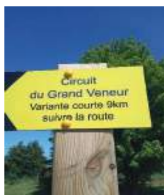
Signalétique des chemins de randonnée