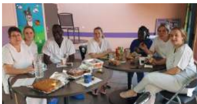
Solidarité gourmande – Merci à nos habitants pâtisseries