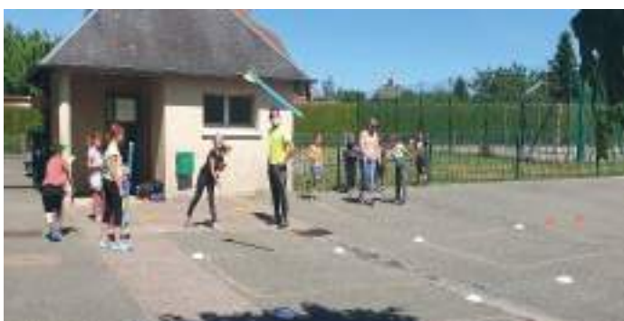
Programme 2S2C par Alliance Loisir à l'école primaire