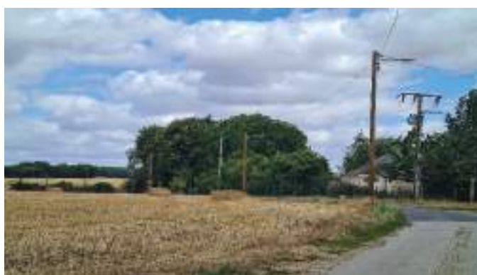
Installation du LED à Entre deux Boscs